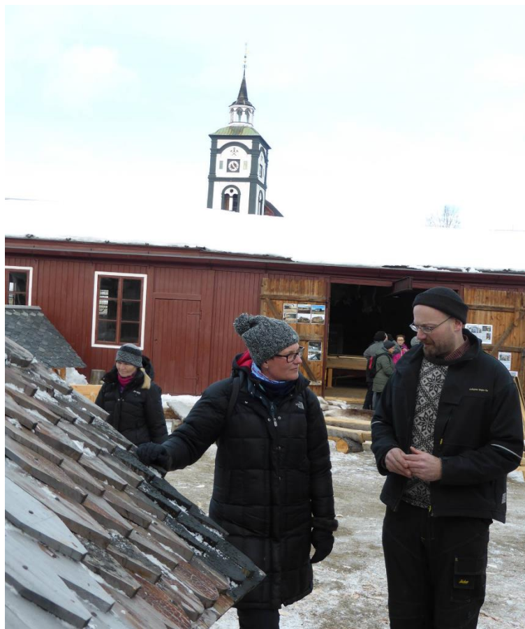
Ministeren får en innføring i materialkvalitet og tjærebehandling av kirketak