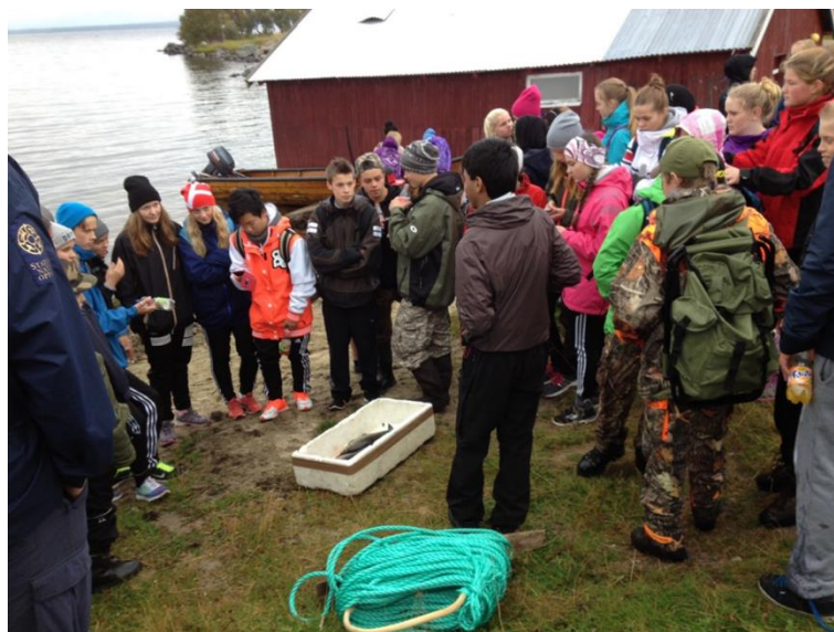
Skoleopplegg sammen med statens naturoppsyn i Elgå

I tillegg forvalter avdelingen friluftsområdet ved Doktortjønna, med økonomisk driftsstøtte fra Røros kommune og utviklingsstøtte fra Sør-Trøndelag Fylkeskommune.