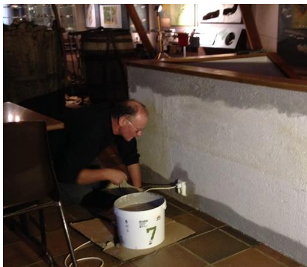
Oppfrisking av museumsbygningen på Olavsgruva

Lagerteltet i Stamphusveien er reparert og forsterket med en gavlvegg i reisverk og plater. Lagerporter er montert og forenkler adkomsten inn i lageret.