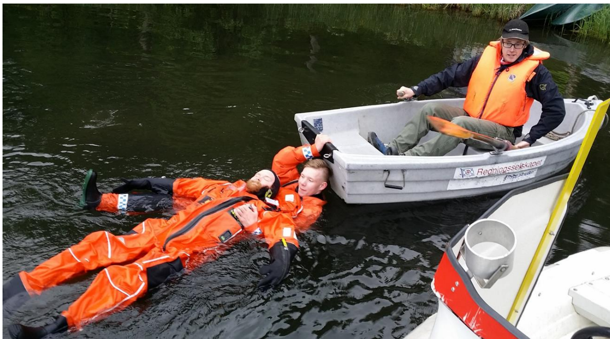
Sikkerhetskurs på Dokkortjønna, opplæring av sommeransatte

Formidlingsavdelingen har 3 fast ansatte, samt avdelingsleder som er ansatt på kulturhistorisk avd. I tillegg har avdelingen et 20-talls sesongansatte for å ta unna en hektisk sommersesong. Rekruttering og opplæring av sesongansatte er en svært viktig del av avdelingens ansvarsområde, både for å gi publikum en god opplevelse og av sikkerhetsmessige hensyn. Vertene våre skal ha god kunnskap om alt fra områdets historie, formidling og kundebehandling til brannslukking og sjøredning.