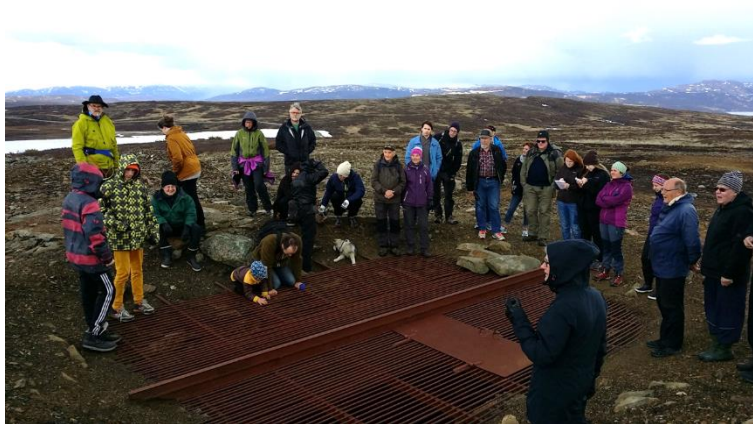
Omvisning på Storwartz, Corneliasjakta

Rørosmuseets besøkstall har gått både opp og ned og opp igjen siden de første registreringene i 1988, men ut fra tallene det ser ut som vi har gjort en brukbar jobb mot publikum de siste 10 årene.