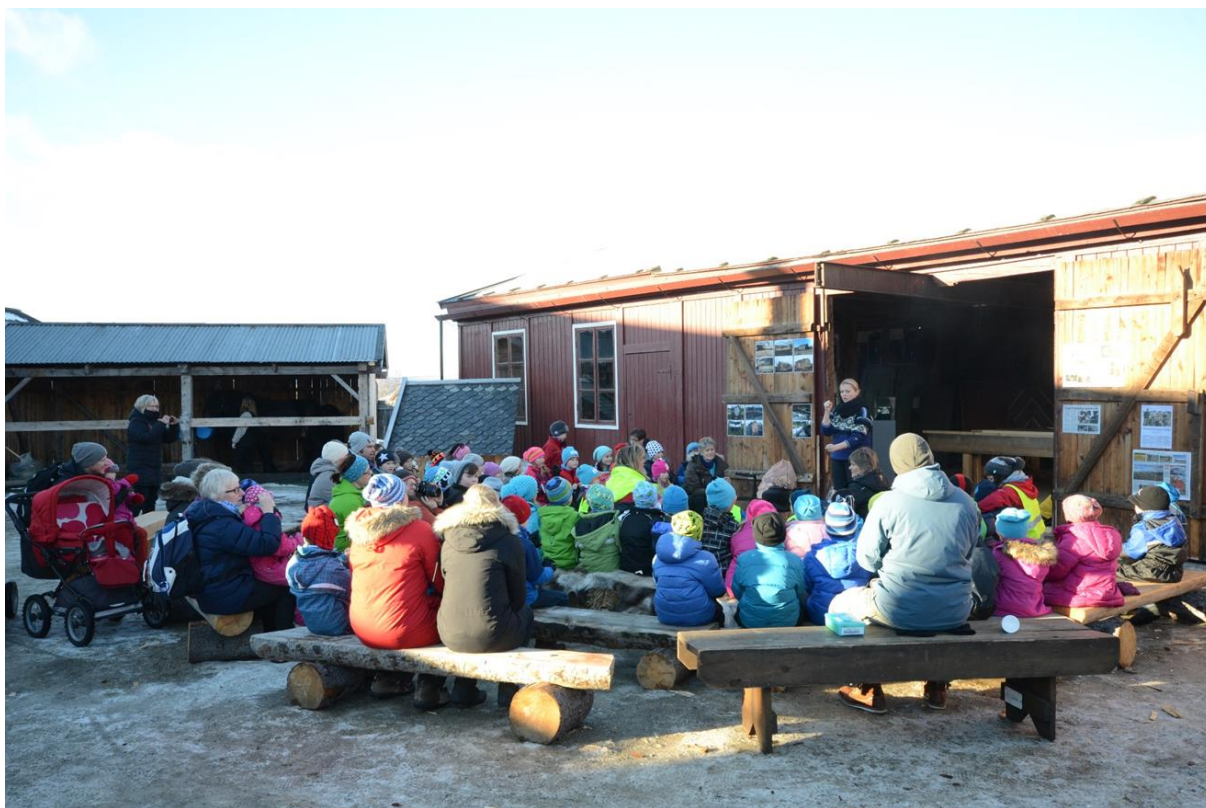
Fortellerstund i Kurantgården under Rørosmartnan

Rørosmuseet består av mange enheter. Besøkstillene varierer mye mellom stedene, det gjør også lengden på besøket; fra turisten som stikker hodet innom i Spjellstuggu på tur gjennom Sleggveien til håndverkeren som bruker en langhelg i måneden på å tilegne seg kvalifikasjoner gjennom fagskoleutdanningen. Og ikke minst de mange interesserte som er gjengangere på Rørosmuseets arrangementer gjennom året.