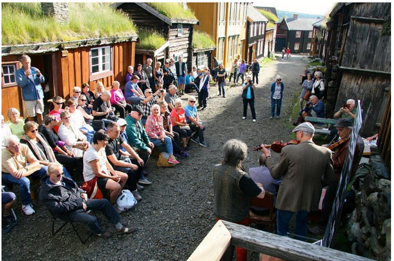
Torsdagskveld i Sleggveien, et av de mange arrangementene i løpet av året.

«Verdensarven som veiviser» er et stort skoleopplegg under oppbygging. Opplegget skal til slutt omfatte hele skoleløpet t.o.m. videregående skole, i tillegg til barnehager. I 2015 har vi prøvd ut delprosjekter i 3., 5. og 8. trinn, i tillegg til opplegg med valgfag «Levende kulturarv (8.-10. trinn)». 5. trinn ved rørosskolene og Os fikk en dag med innføring i kvartærgeologien – hvordan landskapet i Rørosdistriktet ble dannet. 8. trinn på Røros var en dag i Femundsmarka med innføring i kulturhistorie, naturbruk og friluftsliv. I løpet av høsten 2015 har ca. 150 elever på Røros, Os, i Glåmos og Brekken vært med på skoleoppleggene.